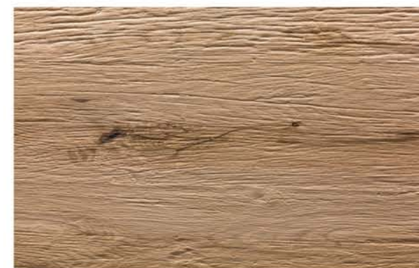
Eiche Prägeboard Attersee