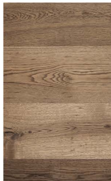
HTR Eiche Rustikal 8