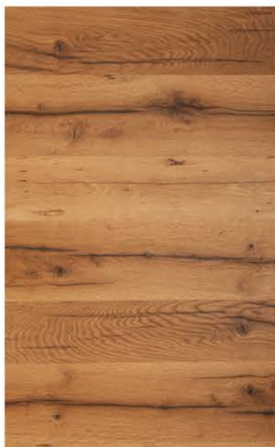
HTR Eiche Rustikal 2