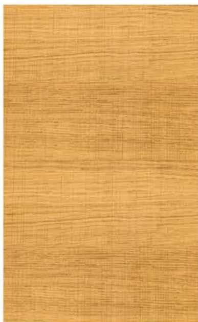
HTR Eiche Rustikal 14