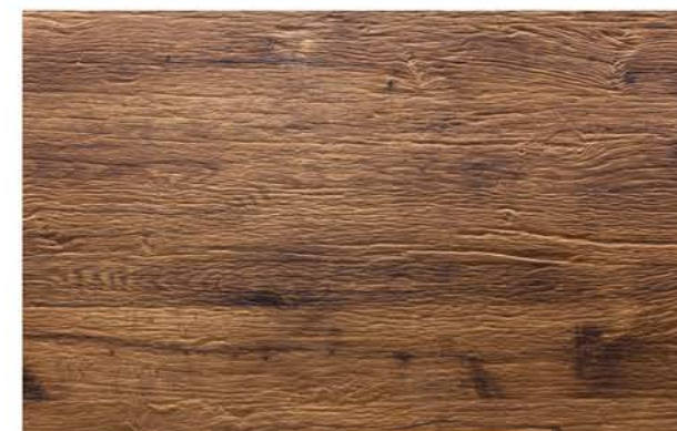
Eiche Prägeboard Altaussee