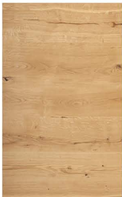
HTR Eiche Rustikal 1