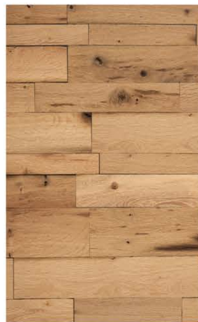
HTR Eiche Rustikal 15