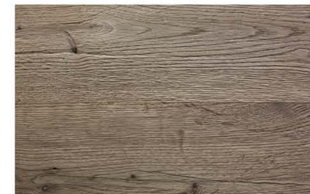
Eiche Prägeboard Mondsee