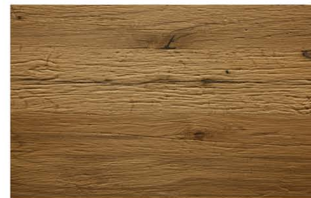
Eiche Prägeboard Wolfgangsee