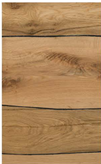
HTR Eiche Rustikal 12