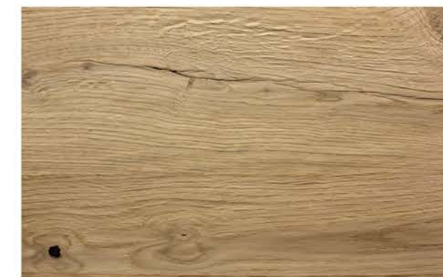
Eiche Prägeboard Traunsee